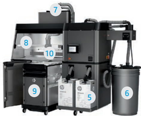
Bild zeigt HP Jet Fusion 3D 4200/3200 Drucklösung