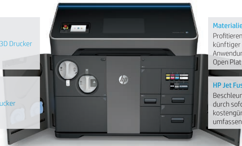
Abbildung: HP Jet Fusion 580 Color 3D Drucker

HP Jet Fusion 540/340 3D Drucker 4-Agent-Konfigurierbarkeit